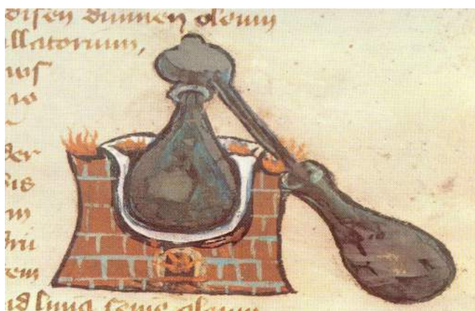
Alambic représenté sur un manuscrit médiéval