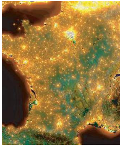
La pollution lumineuse en France

C ette manifestation nationale existe depuis sept ans déjà et a pour but de nous faire redécouvrir la nuit, avec ses paysages, sa biodiversité et son ciel étoilé. C'est aussi l'occasion de sensibiliser le grand public à la protection de la faune nocturne et au ciel étoilé et de prendre conscience des conséquences quelquefois dramatiques de la pollution lumineuse pour de nombreuses espèces animales. D'année en année, l'engouement pour cette nuit a suscité partout en France un bon nombre de partenariats avec, in fine , une première série de mesures gouvernementales réglementant davantage l'éclairage public, commercial et/ou culturel (bâtiments remarquables, classés...).