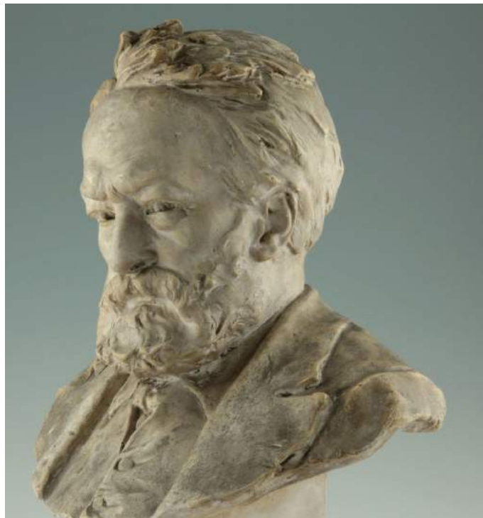
L'œuvre originale du sculpteur Louis Ernest Barrias.

Dans son numéro 21 du 16 février 1902, le Journal des Instituteurs informe ses lecteurs de l'initiative des